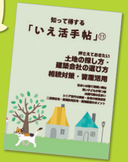
住まいづくりの ノウハウ本 「いえ活手帖」